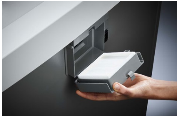
Dahle Aktenvernichter Waste 206air