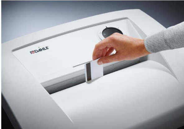
Vernichtet zuverlässig Karten