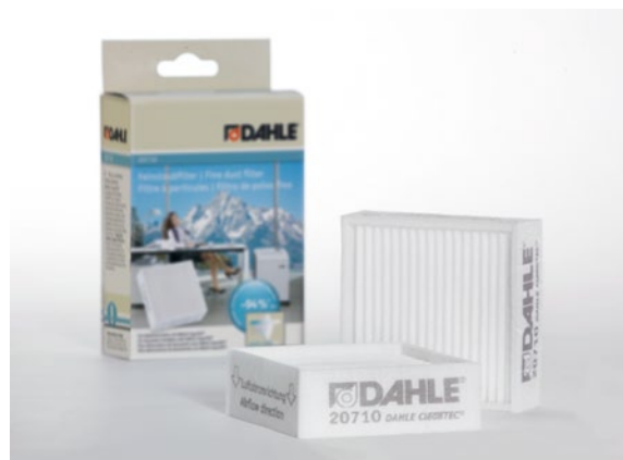
Feinstaubfilter Dahle 20710