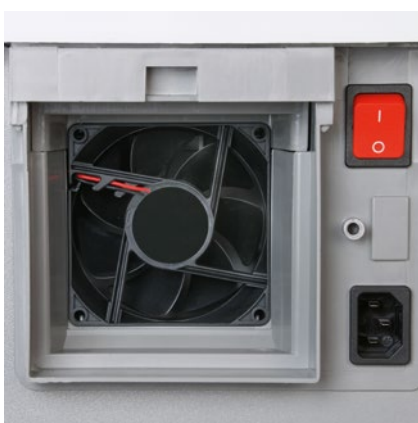
Leistungsstarker Ventilator saugt die Feinstaubpartikel im Inneren des Aktenvernichters an und leitet sie zum Filter