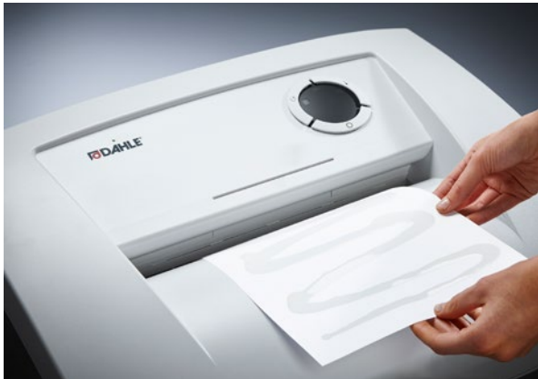
Dahle Aktenvernichter Waste 206air