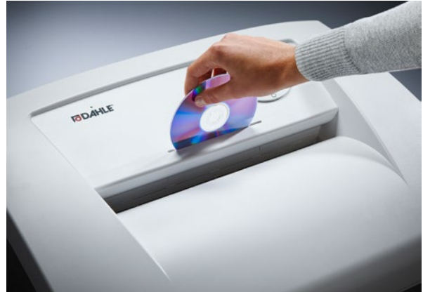
Separater CD-Schlitz mit eigenem Auffangbehälter für eine umweltfreundliche Abfalltrennung und sichere Vernichtung