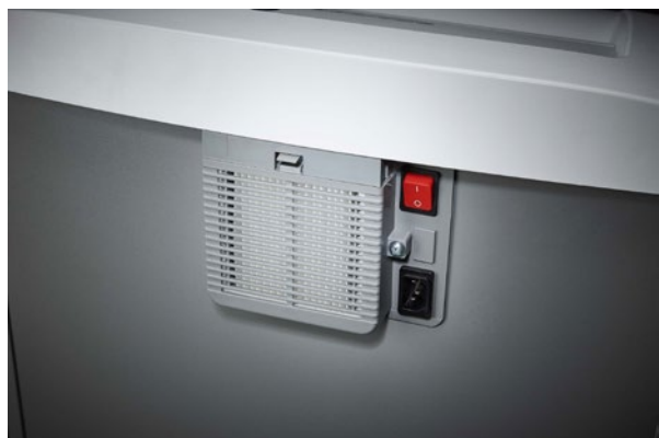
Separater Hauptschalter befindet sich auf der Rückseite des Aktenvernichters und trennt diesen komplett vom Netz