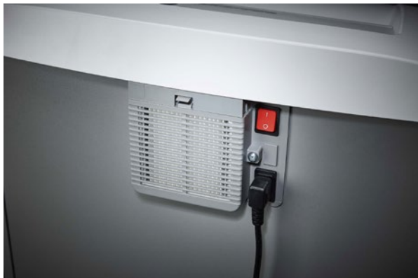
Abziehbarer Kaltgerätestecker vereinfacht das schnelle Bewegen des Aktenvernichters von A nach B