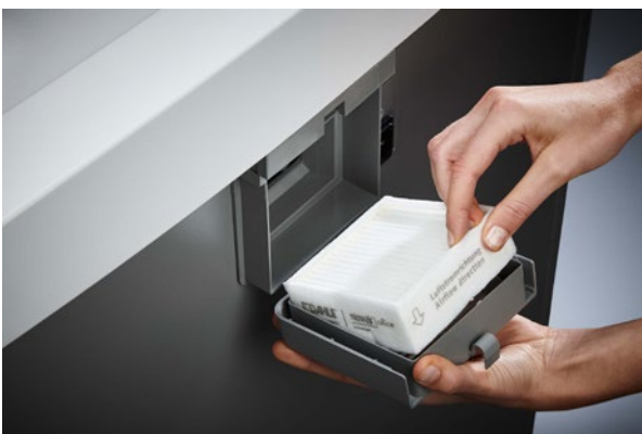
Verbessertes Raumklima trotz Hochleistungsbetrieb: das einzigartige Filtersystem DAHLE CleanTEC® reduziert die Feinstaubbelastung des Aktenvernichters