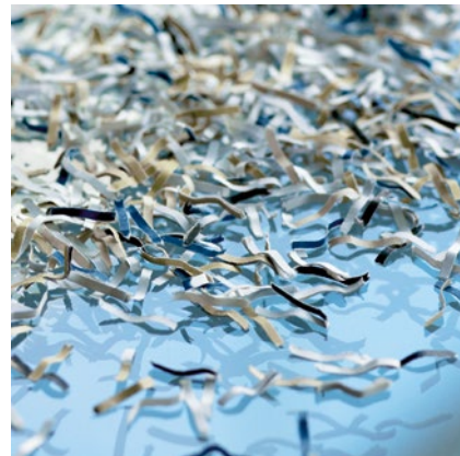
Sicherheitsstufe P-5: Empfohlen für Datenträger mit geheim zu haltenden Daten