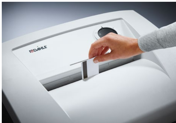
Vernichtet zuverlässig Karten