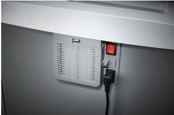
Abziehbarer Kaltgerätestecker vereinfacht das schnelle Bewegen des Aktenvernichters von A nach B