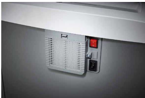
Separater Hauptschalter befindet sich auf der Rückseite des Aktenvernichters und trennt diesen komplett vom Netz