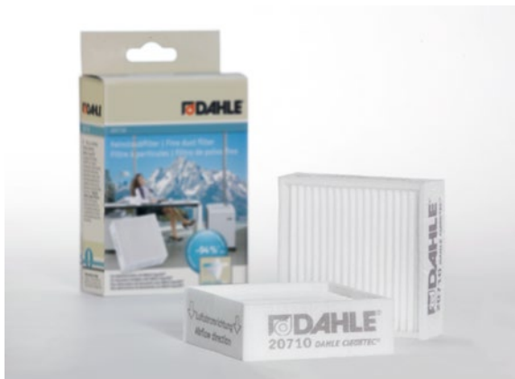
Feinstaubfilter Dahle 20710