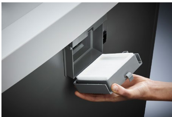
Dahle Aktenvernichter Security 510air L plus