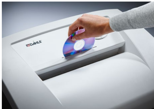
Separater CD-Schlitz mit eigenem Auffangbehälter für eine umweltfreundliche Abfalltrennung und sichere Vernichtung