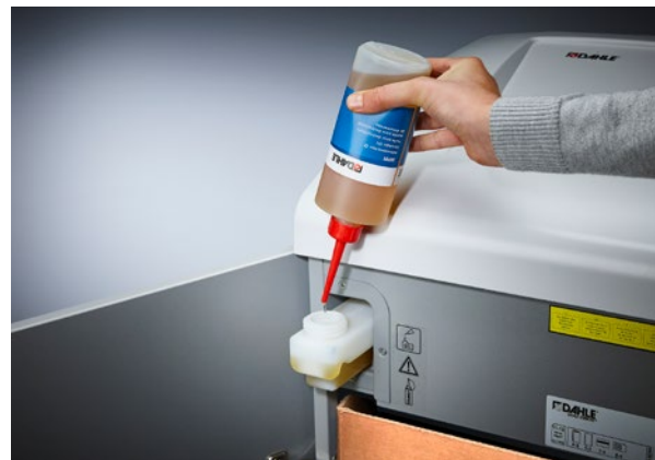
Zuverlässig shreddern mit automatischem Öler: einfach mit Öl befüllen, alles Weitere übernimmt der Aktenvernichter