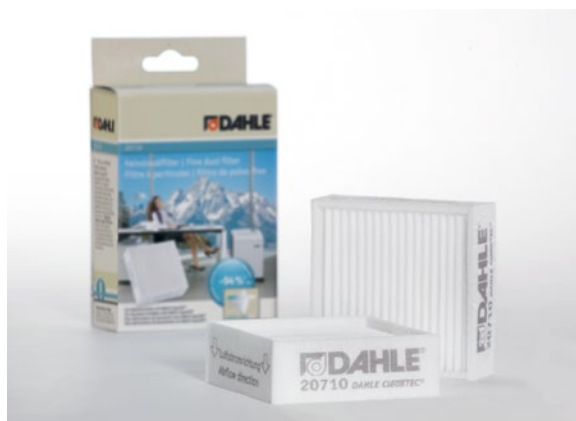
Drobné filtry částek staých Dahle 20710

Ekologický filtr z 3vrstvé, plně recyklovatelné speciální netkané textilie